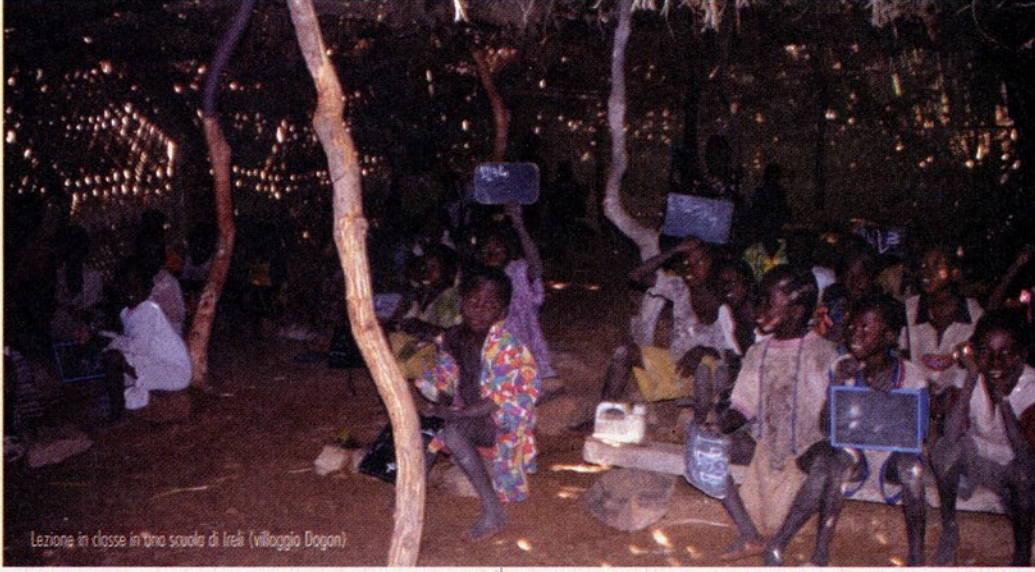
Lezione in classe in una scuola di Ireli (villaggio Dogon)