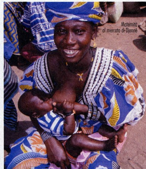
Maternità al mercato di Djenné