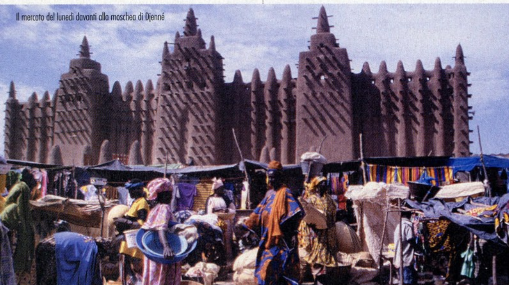
Il mercato del lunedì davanti alla moschea di Djenné

Ho chiesto a un giovane cosa fa la gente nei mesi di siccità. Ha risposto: "Quasi niente, perché solo la piog-