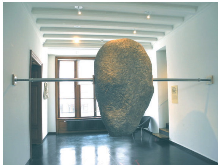
Elmgreen & Dragset "Hanging Rock" 2017, resina epossidica, lacca, alluminio e legno, 265 x 110 x 410-510 cm, Art Parcours 2018, Museo di Arte Antica

Volta , pur se in veste non concorrenziale, negli stand italiani ha mantenuto la sua dignità: Bianconi e The Flat (Milano), Caldirola (Monza), Casciaro (Bolzano), E3 (Brescia), Ghetta (Ortisei), Marra e Montoro 12 (Roma), Privateview (Torino), Verrengia (Salerno). Scope è stata ancora piuttosto deludente, quindi in quel contesto