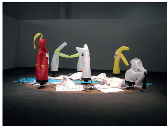
Paul Chan "Bothers on Ogygia" 2018, installazione con plastica e ventilatori, Art Basel 2018, sezione "Unlimited", 226 x 754 x 711 cm (courtesy Green Naftali Gallery, New York e l'Artista; ph L. Marucci)

Al secondo piano, la Collectors Lounge (frequentata da Vip) ospitava l'installazione I viaggi della mente – Omaggio a Emilio Isgrò , a cura dell'architetto Piero Lissoni (art director della Sanlorenzo Yacht), rivelatasi esemplare e competitiva. 'Partiva' da un'edizione di Odysseia di Omero del 1968 (opera proveniente dalla Galleria Tornabuoni) con le tipiche cancellature dell'artista, posta al centro di una stanza, asettica ed evocativa, con le tre pareti 'affrescate' da testi cancellati e in basso bacheche minimali contenenti modelli di motoscafi da competizione. Il tutto, rigorosamente in bianco e nero, si combinava armonicamente nell'ambiente, generando una calibrata ed elegante percezione d'insieme, tra mitologia e radicalità linguistico-culturale depurata da conformismo iconografico. Il lavoro, dal forte impatto