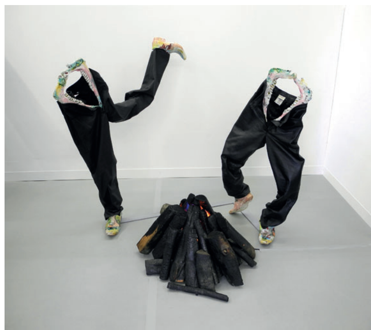
Kris Lemsalu "Bambo Dance" 2017-18, porcellana, tessuto, metallo, pelle e legno, 160 x 180 x 100, Liste Art Fair 2018 (courtesy Temnikova & Kasela Gallery, Tallinn-Estonia; ph L. Marucci)

Design Miami , forum per l'industrial design e l'oggettistica è stata più selezionata del solito. Si notavano la Gallery All di Los Angeles/Pechino che proponeva una serie di sedie per sale da convegni, esteticamente originali, del cinese Zhang Zhaujie; la Galerie Vivid di Rotterdam (diretta da Aad Krol) con una decina di pezzi unici realizzati prima del 1964 da Gerrit Rietveld, a iniziare dalla "Red Blue" del 1919 fino a un'altra iconica sedia disegnata nel 1963 per Steltman Jewelry; lo stand "Disco Gufram" della Ditta italiana operativa in provincia di Cuneo che ha allestito un confortevole ambiente dichiaratamente plurisensoriale per luoghi di ricreazione come le discoteche.