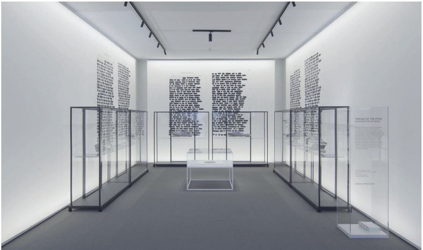
“I viaggi della mente – Omaggio a Emilio Isgrò” 2018, installazione della Sanlorenzo Yacht a cura di Piero Lissoni, Art Basel Collectors Lounge