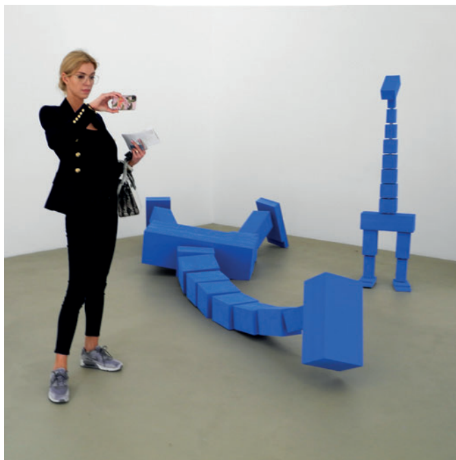
Hito Steyerl "Hell Yeah We Tuck Die" 2017. Visitatrice che fotografa un particolare dell'installazione multimediale nell'esposizione "War Games" 2018 realizzata con Marta Rosler al Kunstmuseum Gegenwart di Basilea