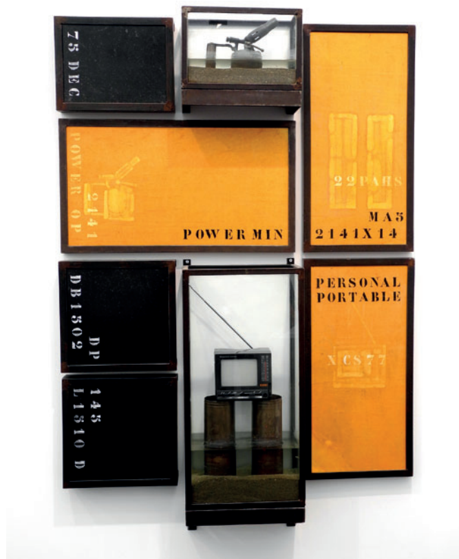
Chen Zhen "L'Autel n° 5" 1993, metallo, vetro, foglio di plastica autoadesivo, carta di riso, pittura acrilica bianca e nera, sabbia, acqua, oggetti, 137 x 93,5 x 21,5 cm

dando luogo alle settimane dell'arte, in cui si stabiliscono prolifiche sinergie tra organismi pubblici e gallerie private. Anzi, a volte le mostre sono così numerose da renderne impossibile la fruizione in pochi giorni. Vedi Basilea, Londra e Parigi e da noi stanno percorrendo questa strada Bologna, Milano e Torino.