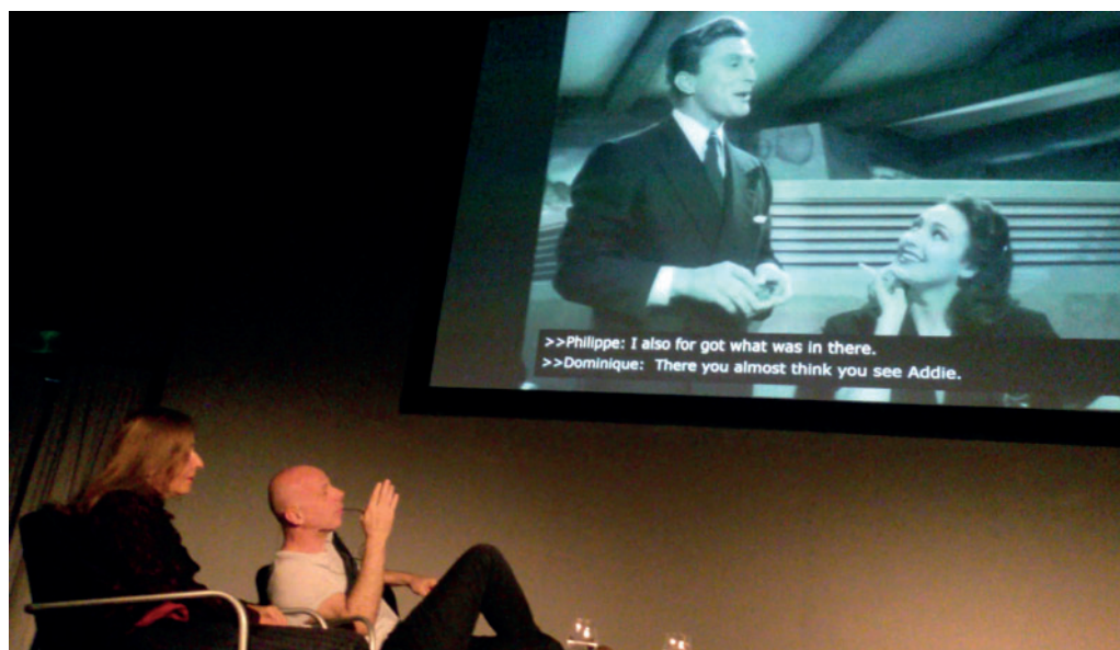
Dominique Gonzalez-Foerster e Philippe Parreno durante il loro talk del 6 ottobre scorso nell'Auditorium di "Frieze London"

Frieze Sculpture Park è la sezione en plein air , tutt'altro che marginale, di Frieze London , specialmente quest'anno che è stata potenziata aumentando il numero degli artisti prescelti (ventiquattro) e che l'esposizione, aperta in anticipo, durava tutta l'estate per estenderne la fruibilità pure ai turisti che frequentano l'English Garden di Regent's Park. La curatrice Clare Lilley ha privilegiato la produzione scultorea di tipo museale – proposta da note gallerie private e pubbliche o da collezionisti in gran parte britannici – di buon livello qualitativo, eseguite con tecniche alquanto tradizionali. Quindi lungo il percorso si incontravano accattivanti lavori più o meno monumentali, firmati da Paolozzi, Barceló, Venet, Caro, Rondinone, Chamberlain o su piedistallo di Reza Aramesh, Thomas J Price, Emily Young. Introverso ed