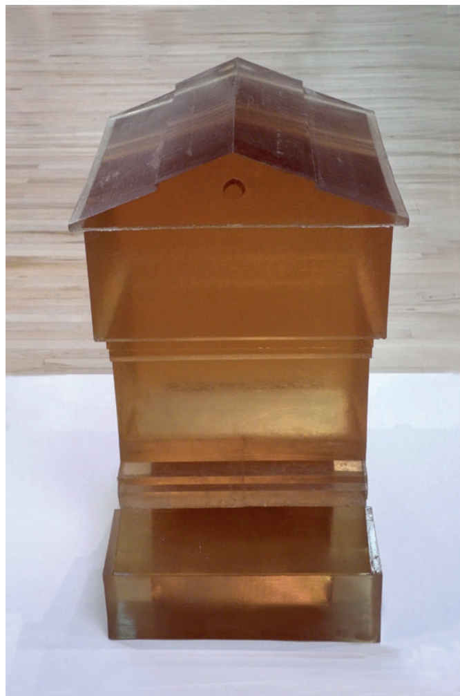
Rachel Whiteread "Untitled (Hive) I" 2007-2008