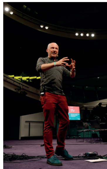
Il matematico dell'Università di Oxford Marcus du Sautoy parla di "How to make a Zombie"

(Conversazione via Skype, 2 novembre 2017, ore 1,39-1,55)