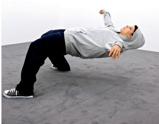
Xu Zhen, "In Just a Blink of an Eye" 2005/2014 nella mostra di performances "14 Rooms", dal format originale, curata da Obrist e Klaus Biesenbach a Basilea nel 2014

Indubbiamente è uno strumento tra i più documentativi che aiuta a scrivere brani di storia attraverso la cronaca dei processi evolutivi del quotidiano, prescindendo dai trattati teorici che si addicono maggiormente ai libri, peraltro di difficile pubblicazione e di limitata diffusione.