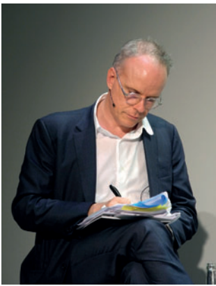
Obrist prende appunti durante il talk "Artistic Practice | The Artist as Archeologist" del 19 giugno 2015 nell'ambito di Art Basel Basel

bliche e le mostre innovative possono incentivare le ricerche degli artisti, ma egli insiste nel considerarli gli unici detentori della creatività. Predilige l'architettura moderna, i film sperimentali e le azioni performative (lo prova, ad esempio, la grande stima che ha per Philippe Parreno, Douglas Gordon e Tino Sehgal). Una delle sue mostre più trasgressive è Take Me (I'm Yours) , progettata con Christian Boltanski nel 1995 per la Serpentine Gallery di Londra, riproposta dal 2015 a Parigi, Copenhagen, New York, Buenos Aires e ora, con altre presenze, all'HangarBicocca di Milano (visitabile fino al 14 gennaio 2018). La formula può sembrare troppo giocosa ma, a ben guardare, è stata ideata con rigore e per democratizzare l'opera provocando una fruizione attiva.