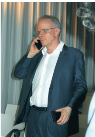
HUO mentre parla a uno smartphone e nella mano sinistra ne ha un altro: strumenti da lui costantemente usati per la sua attività

e alla rivisitazione degli anziani pionieri che incrementano l'attualità; l'arte di fare mostre con inusuali format (derivati agli esordi dagli insegnamenti del suo conterraneo Harald Szeemann e dai consigli di Alighiero Boetti); l'interesse per l'interdisciplinarietà e l'interazione. Non a caso viene chiamato anche a far parte di giurie di prestigiosi premi. Grazie all'autorevolezza acquisita con molteplici lavori propositivi, riesce ad attivare istituzioni culturali, a creare sinergie e a coinvolgere gli sponsor indispensabili a realizzare progetti ambiziosi. Secondo me i suoi scritti, le discussioni pub-