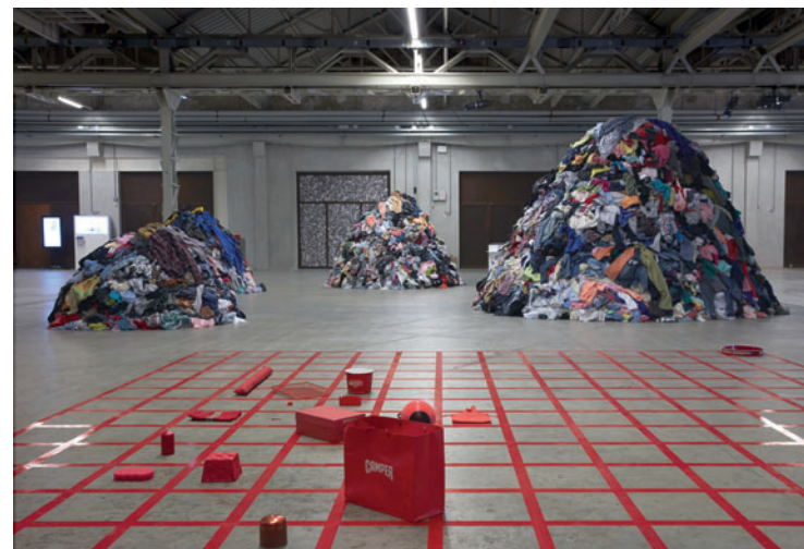
Una veduta della mostra "Take Me (I'm Yours)" con l'opera "Homage to Each Red Thing" di Alison Knowles (in primo piano) e "Dispersion" 1991-2017 di Christian Boltanski, Pirelli HangarBicocca, Milano, 2017

(Conversazione via Skype, 23 settembre 2017, ore 01.27-02.00)