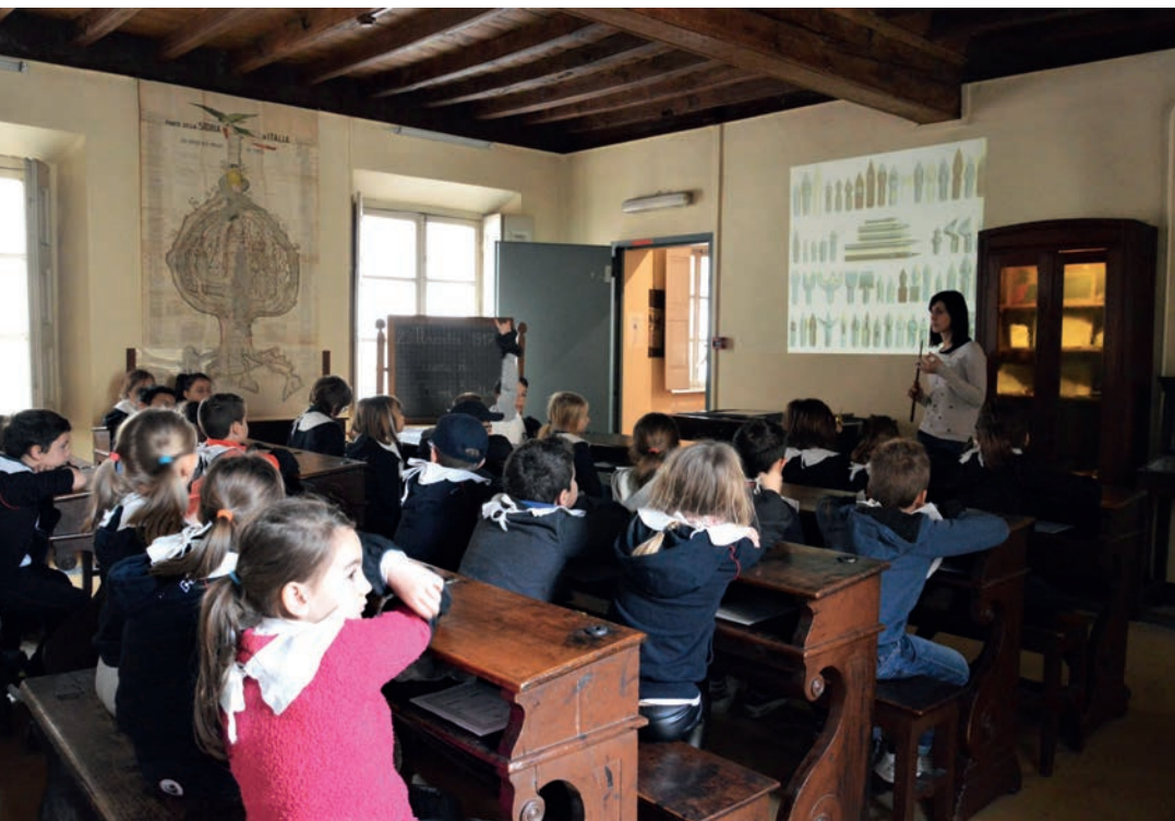
sopra: Laboratorio "Scriviamo in bella" nell'aula di inizio '900 del Percorso Scuola