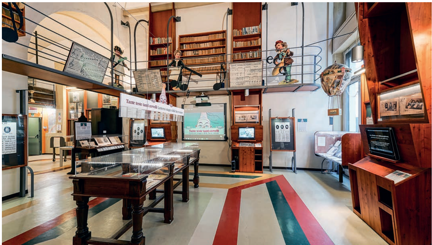
Percorso Libro, Biblioteca fantastica

scuole di ogni ordine e grado, principalmente scuole primarie del Piemonte e non solo. Non mancano classi provenienti da altre regioni, ad esempio dalla Lombardia, dalla Liguria, dalla Valle d'Aosta, ma anche dal Trentino e dalla Toscana. Il MUSLI però non è solo un museo da visitare, ma anche da vivere, ed è chiaro che ci sono scuole particolarmente privilegiate nel rapporto con la nostra realtà: gli istituti scolastici storici di Torino, quelli che ancora conservano materiale didattico di una volta, i quali non si limitano alla sola visita del nostro Museo, ma ci coinvolgono per la realizzazione di progetti conservativi ed espositivi. L'esistenza del nostro museo non sarebbe possibile se non ci fosse un rapporto stretto con il territorio, perché il passaparola delle maestre e dei maestri si è da sempre rivelato la carta vincente della nostra realtà.