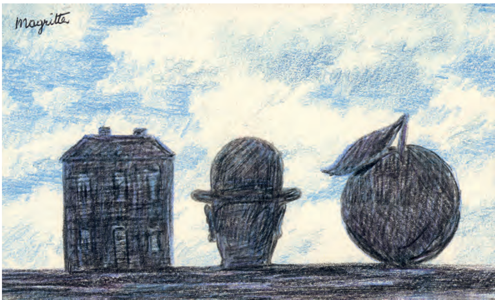
Pastello su cartoncino del 1964, 12,5 x 21 cm