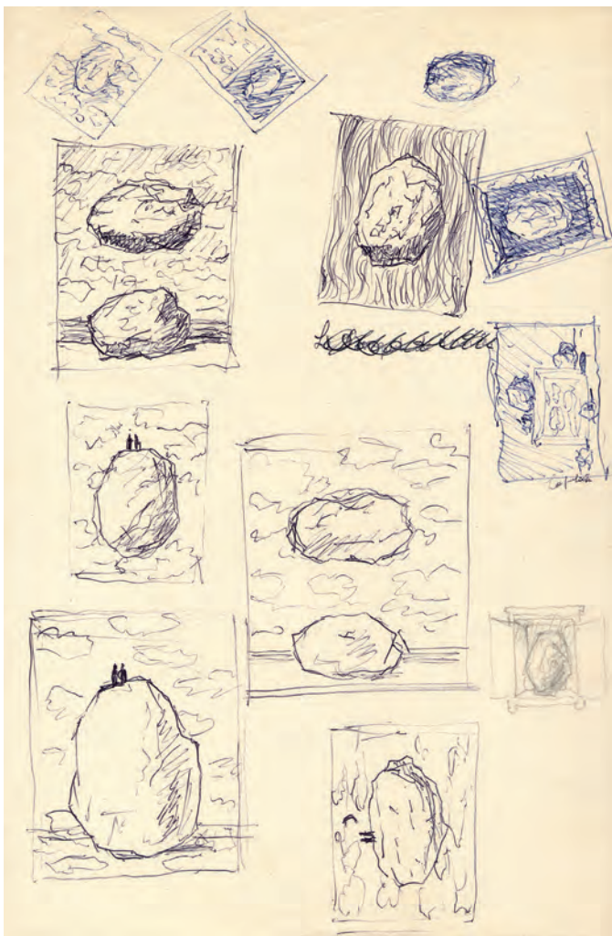
Schizzi, a china e a penna biro su cartoncino, per quadri, 27 x 18 cm. Sul retro 13 piccoli disegni simbolici a matita, ben ordinati, utilizzati in alcuni dipinti: calice, luna, chiave, pesce, colomba, pipa, foglia, mano, arco e quattro figure geometriche semplici

vicinanze c'è ancora il bistrot Le Fleur en Papier Doré (simile al Cabaret Voltaire dei dadaisti a Zurigo), culturalmente ancora attivo. Nel 2009 in Place Royale si è inaugurato il più istituzionale Museo Magritte con 250 capolavori.