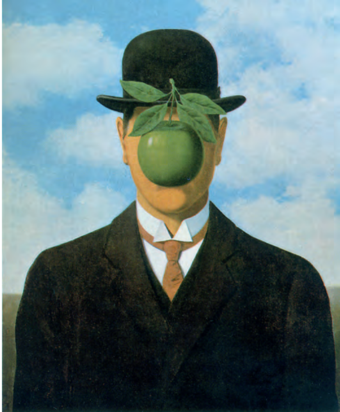
“La Grande Guerre” 1964, poster tratto dal dipinto di 65 x 54 cm

ironico e socievole, ci mostrò la raccolta delle sue pubblicazioni, custodite in una libreria chiusa a chiave, e rimanemmo piacevolmente sorpresi e divertiti dai disegni, appositamente realizzati da Magritte per ciascuna pubblicazione, soprattutto quelli alla maniera di Renoir e del breve periodo vache . Non erano mai stati esposti forse perché riservati e dai soggetti conturbanti. Il poeta ci informò che spesso discutevano a lungo sui titoli da dare ai quadri di Magritte, considerati complementari alle opere.