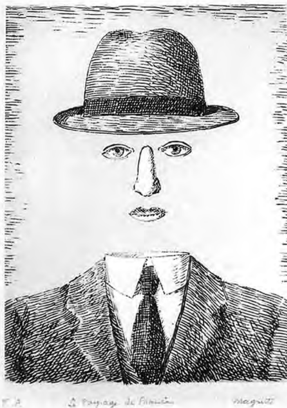
"Le Paysage de Baucis" 1966, acquaforte, foglio 37,7 x 27,6 cm / lastra 22,8 x 16,9 cm

[Questo è l'ultimo articolo, in forma di diario (rimasto inedito), scritto insieme a mia moglie nell'aprile del 2019, poco prima che ci lasciasse improvvisamente, portando via con sé tanti altri bei ricordi del nostro intenso vissuto nell'arte (l.m.)]