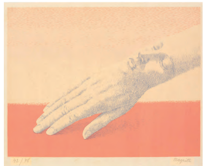
"Les Bijoux Indiscrets" 1963, litografia, 24,5 x 31,5 cm