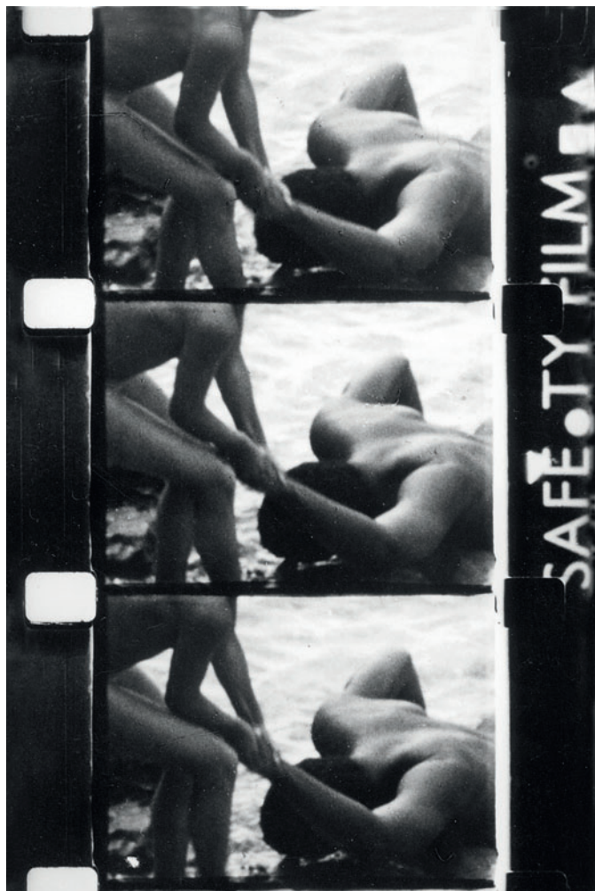
Gianfranco Baruchello, "Perforce" 1968, fotogrammi dal film 16mm, colore, sonoro, 15', dal catalogo dell'VIII Biennale d'Arte Contemporanea di San Benedetto del Tronto "Al di là della pittura", 1969

C'erano tangenze con il movimento del Sessantotto? Una parte dei miei film 'brevis' (anni '60) – tra i quali Costretto a scomparire , Perforce o Complemento di colpa – certamente alludevano a umori politici dell'epoca oggi incomprensibili ai più. La guerra del Vietnam prima e il Sessantotto poi furono fatti ma anche vita e questioni che non potevano restare senza una seppur minima risposta. I miei film, ma anche la mia pittura o molti oggetti di quegli anni, erano critici e ironici, perché per me l'ironia è da sempre stata usata come un innocuo ma efficace strumento di critica politica. Era anche critico disinteressarsi delle mode, fare 'cinema' quando invece ero considerato più un pittore, usare la cinepresa per dire le stesse cose che avrei potuto dire con qualsiasi altro mezzo. C'era una sorta di anti-formalismo in tutto questo.