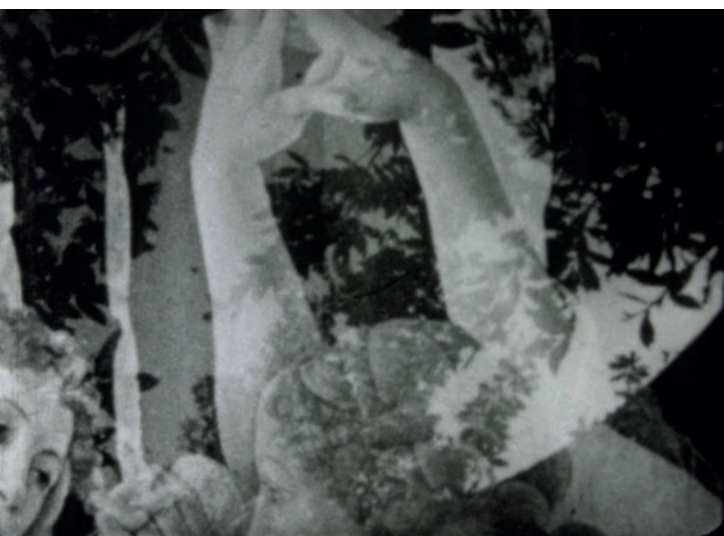
Massimo Bacigalupo, "60 metri per il 31 marzo" 1968, film muto, b/n, 8mm gonfiato in 16mm, durata 12'

Negli ultimi anni alla rivisitazione del cinema sperimentale italiano hanno contribuito anche i nuovi media? Non mi risulta che ci sia stata una rivisitazione complessiva del cinema sperimentale italiano, ma solo piccole rassegne curate da gruppi di appassionati, come Home Movies di Bologna, e le proposte dei curatori del Centro Sperimentale di Cinematografia accolte dal Centre Pompidou di Parigi e dalla Tate Modern di Londra con alcune serie tematiche di proiezioni. Poi sono da citare i dodici "omaggi" o interviste in Schegge di utopia - L'underground Cinematografico Italiano questo sconosciuto di Paolo Brunatto (2004), realizzati per un'emittente televisiva, in parte disponibili in rete, come del resto alcuni film