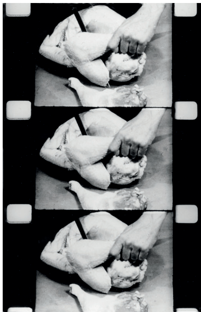
Gianfranco Baruchello, "Costretto a scomparire" 1968, fotogrammi dal film 16mm, colore, sonoro, 15', dal catalogo dell'VIII Biennale d'Arte Contemporanea di San Benedetto del Tronto "Al di là della pittura", 1969

Negli anni Sessanta cosa ti aveva stimolato a fare cinema di ricerca? Ho voluto usare un mezzo tecnico come la cinepresa prima e la telecamera poi, per necessità proprie insite nella personale avventura di una pittura dove la contraddizione, il paradosso, un certo automatismo, il prelievo di elementi del reale hanno formato nel tempo un linguaggio simile a una grande rete elastica pronta ad accogliere ogni esperienza. Erotica, politica, onirica, linguistica che sia, l'esperienza - chiamiamola "avventura" - non ha bisogno di purismi o formalismi, di selezionati modi o strumenti, anzi suggerisce l'impiego (talvolta involontariamente dissacrante) dei mezzi che trova. Se c'è una cinepresa (e c'è, come c'è il frigorifero, il ferro da stiro elettrico) si prova con quella. Così ho fatto in quei primi anni Sessanta e faccio ancora cinema e video (che chiamo comunque film) - come disse quello, "senza chiedere il permesso" - per piacer mio, in modi diversi, ubbidendo a ondate di interessi del tutto differenti. La coerenza,