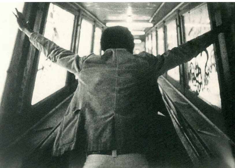
Massimo Bacigalupo, "Warming Up" 1973, film 16mm, colore, scala mobile stazione metropolitana 125th & Broadway di New York (courtesy Archivio M. Bacigalupo)

Il titolo allude a un esercizio, un preludio, una scoperta del mondo che viene letto con modalità cinematografiche ricorrenti. Il film - girato in Liguria e durante un soggiorno di studio a New York - ripropone le visioni infantili, il gioco, la realizzazione di uno spazio artistico. Nella conclusione, operistica, appaiono tre muse newyorkesi: una indossatrice-attrice sul Ponte di Brooklyn, una donna solitaria a Central Park e una creatrice di macchine inutili che metaforicamente vuole richiamare quella del cinema. Warming Up , al limite, è un entusiastico diario visivo.