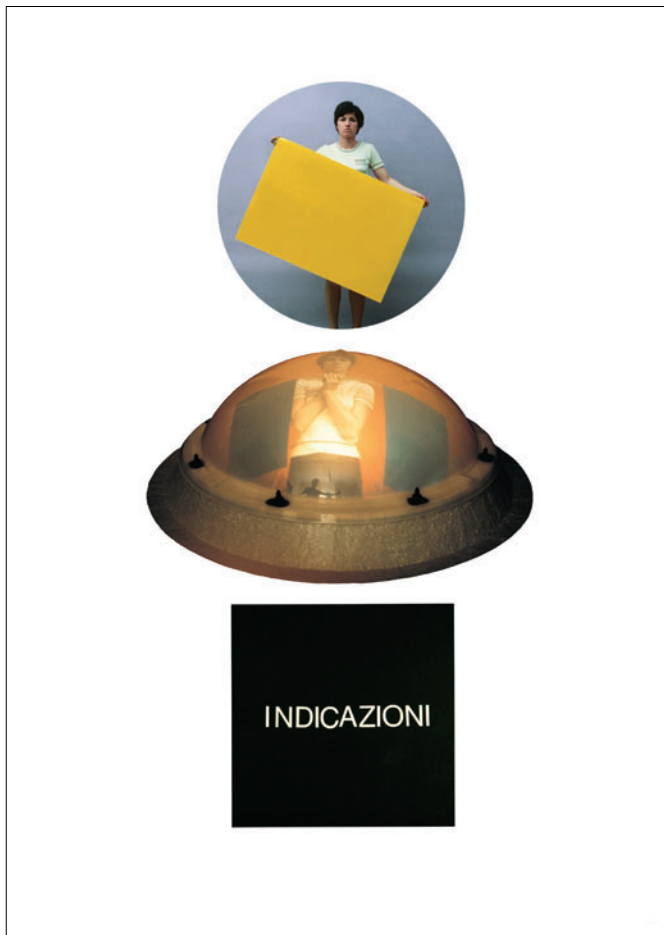
Luca Patella, Indicazioni attive per "Sfere Naturali / Sfere per Amare", 1969 (performer Rosa Foschi)