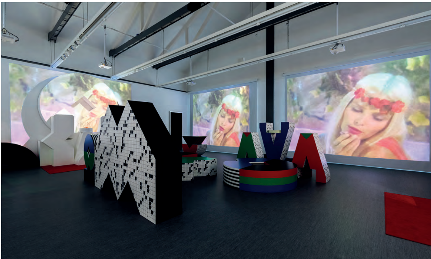
Una veduta della mostra "TV 70: Francesco Vezzoli guarda la RAI", tenuta presso la Fondazione Prada di Milano dal 9 maggio al 24 settembre 2017