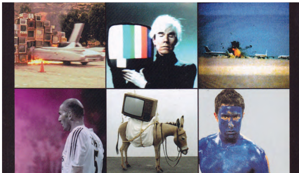
Immagine dalla prima di copertina del libro di Marco Senaldi “Arte e televisione | Da Andy Warhol al Grande Fratello” (postmedia books, 2009)

Dalla volontà di ristrutturare. Diciamo che, proprio lavorando sui rapporti tra filosofia e arte contemporanea, mi sono reso conto (molto gradualmente, devo dire) che il mio vero mestiere consiste proprio nel (destrutturare e) ristrutturare continuamente. Non abitazioni però, ma punti di vista, concezioni estetiche, giudizi critici, valutazioni culturali. Ma, forse, lasciami