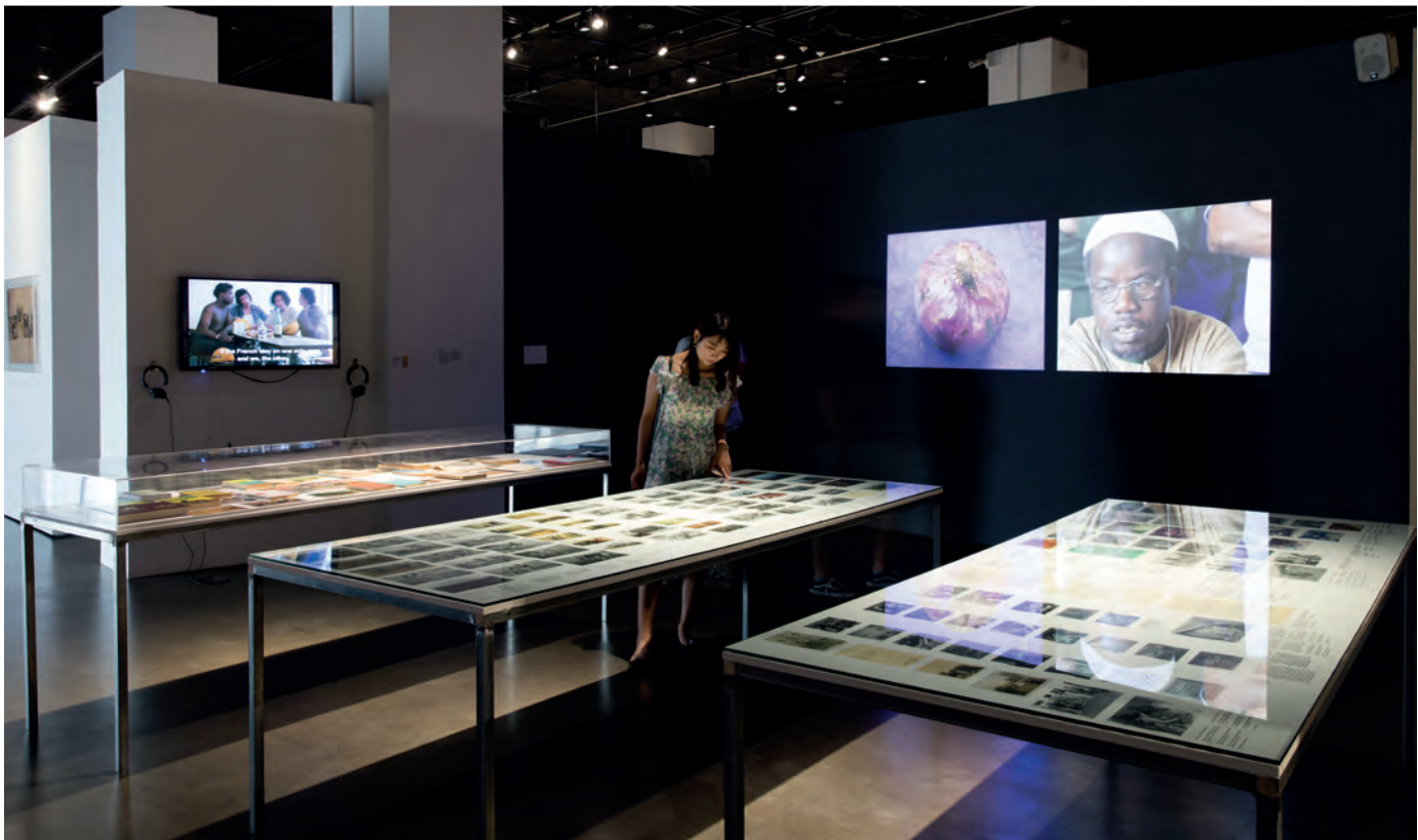
“A Generative Archive”, seconda Biennale di Yinchuan (Cina) 2018, curata da Marco Scotini presso il MOCA di Yinchuan

La Cooperativa auto-organizzata nel villaggio di Somankidi Coura in Mali è stata fondata nel Senegal River nel 1977 da Raphael Grisey, Boubou Touré e altri attivisti che cercano di proporre un'alternativa all'esodo di massa verso l'Europa attraverso forme di agricoltura sostenibile.