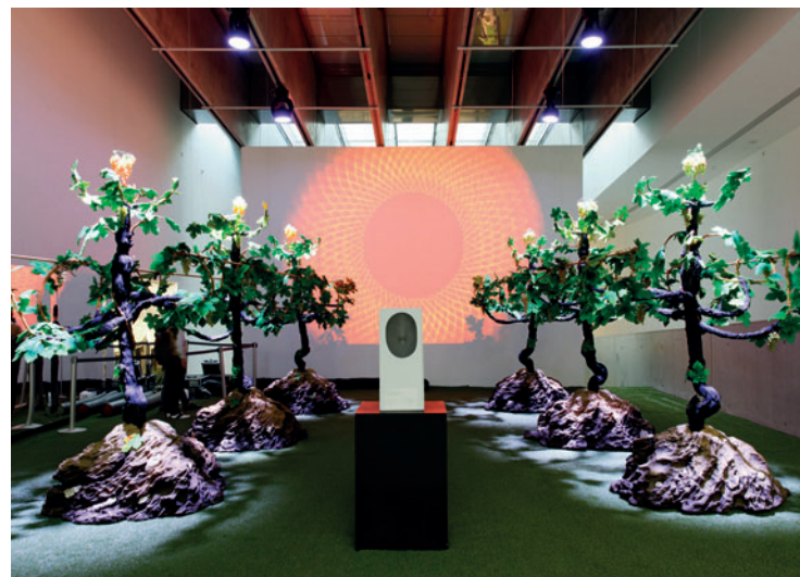
Piero Gilardi "Inverosimile" 2017, ambiente interattivo multimediale (ricostruzione al Museo MAXXI di Roma dell'opera realizzata nel 1989, dimensioni variabili

2. Certamente la libertà dell'immaginario virtuale veicola la produzione di scenari futuri, ma i contenuti nascono sempre dalle tensioni e dalle consapevolezze del presente, nutrito dalle esperienze del passato.