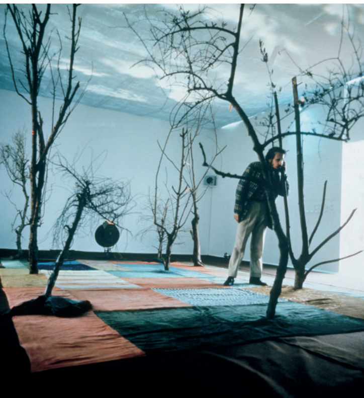
Luca Maria Patella "Alberi Parlanti & Cespugli musicali", materiali vari, dimensione ambiente, Walker Art Gallery Liverpool 1971 e ricostruzione integrale al MACRO 2015-'16 a cura della Fondazione Morra di Napoli

"Su di un Tappeto-prato, patch-work colorato: un Boschetto di Alberi Parlanti (ogni Albero in una di 4 lingue: poesie e testi patelliani ironici o scientifici, voci di Patella, Restany, ecc.) e di Cespugli musicali interattivi, sotto un Cielo di Nuvole in movimento, con uccelli che volano.." (LMP)