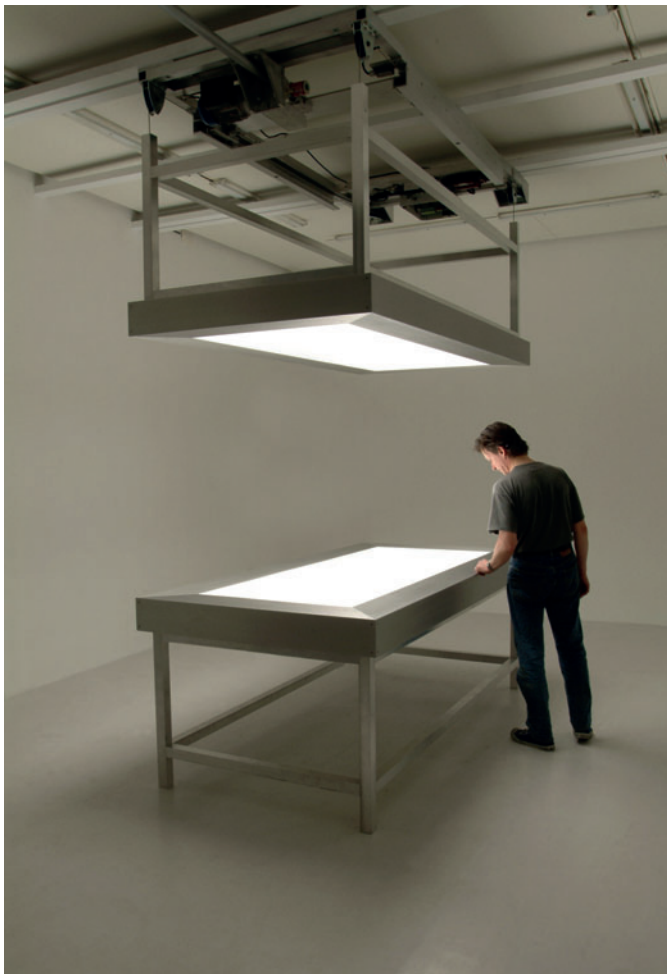
Alfredo Jaar "Lament of the images" 2002, una veduta dell'installazione con due tavoli in alluminio, vetro, perspex, light box, motore, 420 x 248 x 122 cm cadauno "Il lavoro si concentra sulla cecità della nostra società, sulla nostra incapacità di vedere" (AJ)