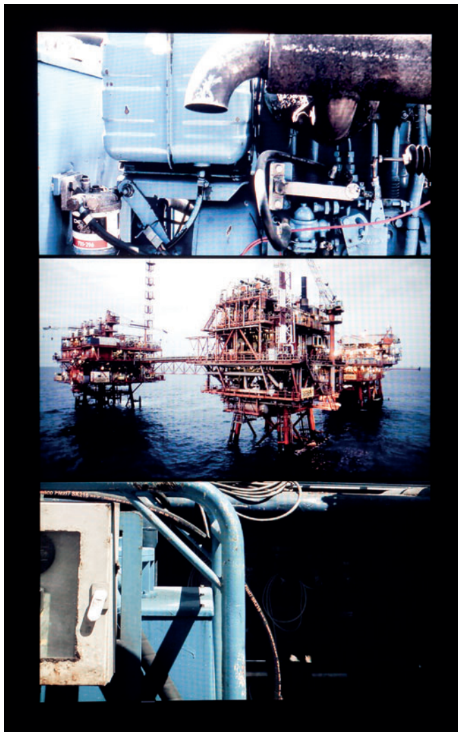
Yuri Ancarani "La Malattia del Ferro" 2012, video installazione, monitor, struttura in ferro, schede video, HD colore, muto, 5 min. loop "Una schiusa di farfalle invade una delle piattaforme Barbare sul Mare Adriatico, nei pressi di Crotone" (YA)

1. Tutto quello che è nuovo è incredibilmente stimolante, nonostante il mondo dell'arte sia lento e diffidente. Mi trovo spesso davanti a richieste di "semplificare" il mio modo di lavorare perché non è collocabile, non è gestibile. Mi viene chiesto spesso