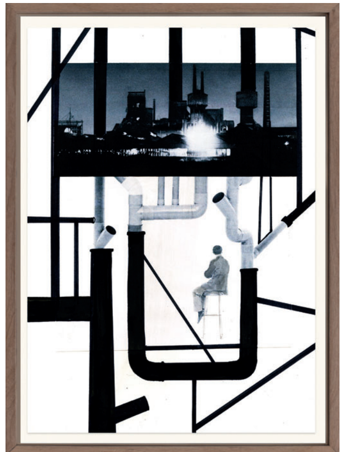
Marzia Migliora "Forza Lavoro #07" 2016, tecnica mista su cartoncino, disegno 34 x 22,5 cm, fotogramma 38 x 26 cm

1. L'arte è sempre specchio del proprio tempo. Tutto quello che ci circonda, se raccolto dallo sguardo di un artista e