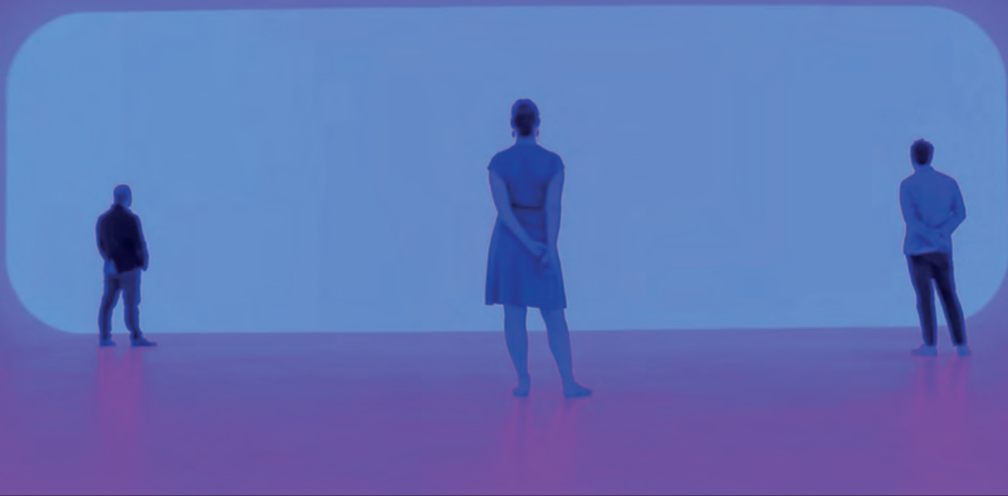
James Turrell, ambiente luminoso allestito per la retrospettiva del 2014 alla National Gallery of Australia di Canberra

un artista troppo poco considerato, forse perché versatile, o scarsamente incasellabile, o pericolosamente al di fuori del sistema dell'arte. In secondo luogo, è stata resa possibile dal bando Italian Council, come la precedente retrospettiva che ho curato su Paolo Gioli, a dimostrazione che da parte del Ministero della Cultura c'è molto interesse verso progetti legati ad artisti meno scontati. Di inedito c'è parecchio per il semplice fatto che, oltre a opere recenti, nell'estetica di Sambin vige la forte tendenza a ripensare le opere del passato, attraverso re-enactment sul versante della performance, aspetto strettamente legato alle installazioni, dal momento che Michele fa interagire i linguaggi della musica, del teatro e del video. L'installazione "Il tempo consuma" – che Sambin ha allestito anche a Marsiglia in una collettiva realizzata nell'ambito del Festival Instant Vidéo – riunisce insieme tre lavori fine anni '70 basati sul video loop , un dispositivo da lui innovato e molto all'avanguardia all'epoca, che consisteva nel far passare lo stesso nastro magnetico da un videorecorder a un lettore creando un meccanismo circolare di registrazione/cancellazione per sottolineare la natura effimera delle immagini e dei suoni elettronici.