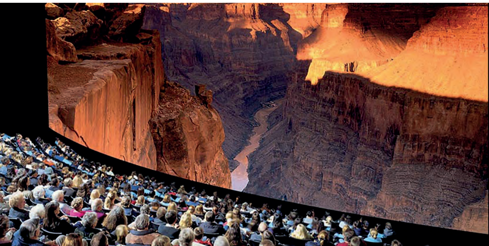
Una veduta interna del Grand Canyon, IMAX Theatre (Tusayan)