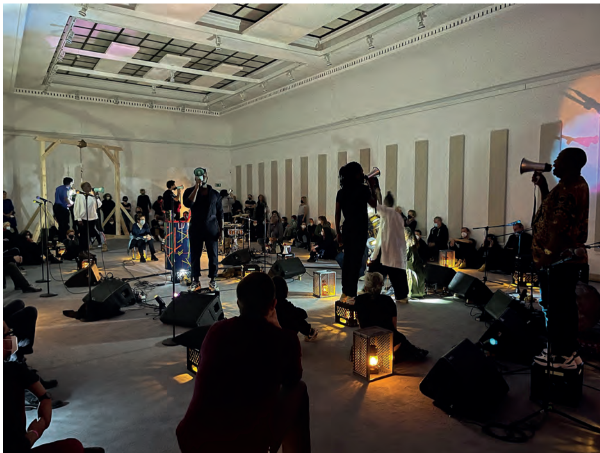
Nora Chipaumire "Nehanda", performance at Haus der Kunst Munich in cooperation with Festival Spielart

intraprendere altre strade e nuove persone si avvicinano. In questo senso ad Haus der Kunst il segno meno visibile ma più rilevante sono le nuove collaborazioni con un team rinnovato, motivato e giovane nei dipartimenti di comunicazione, educazione, produzione e curatoriale. Come strategia generale ho scelto di iniziare nel corso dei primi mesi ascoltando, procedendo poi con un'evoluzione, a cui segue ora una più decisa trasformazione.