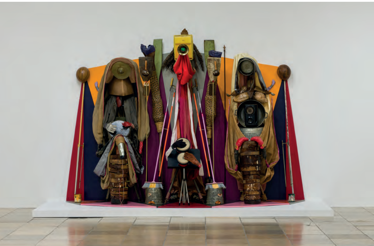
Daniel Lind-Ramos “Con-junto (The Ensemble)” 2015, installation view, group exhibition “Sweat” at Haus der Kunst Munich, curated by Anna Schneider, Raphael Fonseca with Elena Setzer (courtesy HDK; ph Maximilian Geuter),

È un processo lungo e in realtà mai concluso: le istituzioni sono organismi fatti di persone, crescono e mutano insieme, quando la visione muta, le persone normalmente si rimotivano o lasciano per