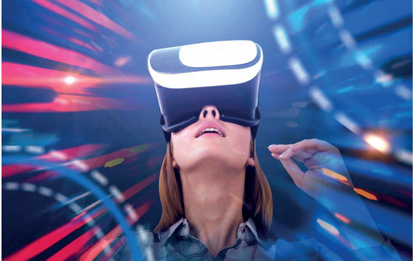
Ragazza con visore della VR