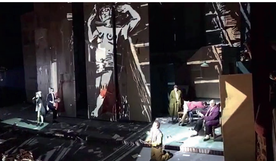
Immagine tratta dalla rappresentazione teatrale di "Lulu" di Alban Berg con regia e scenografia di William Kentridge, Teatro dell'Opera, Roma 2017