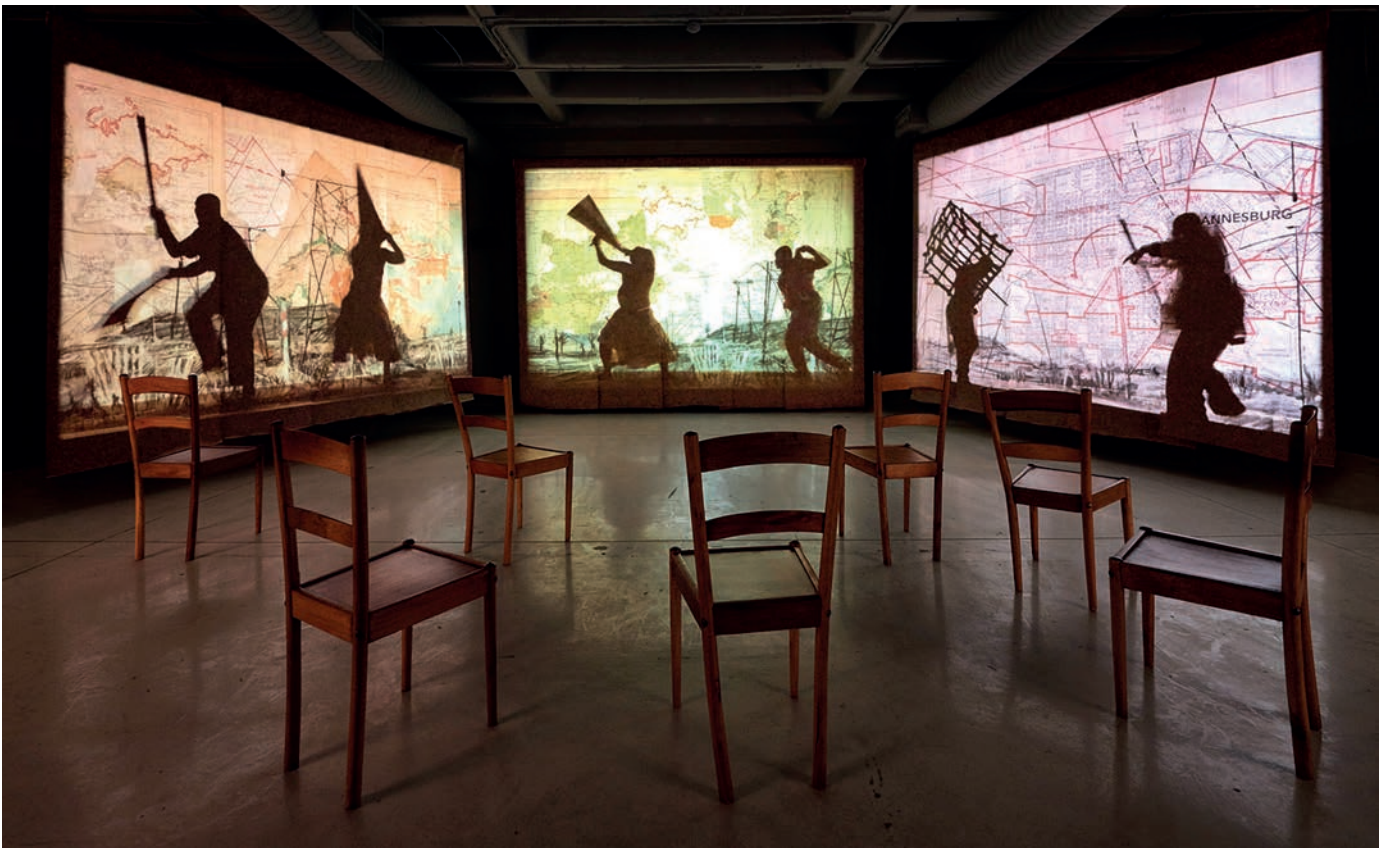
sopra: "Notes Towards a Model Opera" 2014-2015 videoproiezione a 3 canali, colore, suono, durata 11' 14", installazione a Johannesburg, Londra 2015, Pechino 2015, New York, riproposta in Art Basel 2016, sezione "Unlimited"

"Notes Towards a Model Opera" è incentrata sulla storia intellettuale, politica e sociale della Cina moderna ed esplora le dinamiche di diffusione culturale e di metamorfosi della Rivoluzione culturale cinese. L'opera prende in esame i balletti didattici, sia come fenomeno culturale a sé stante sia come parte di una storia della danza che attraversa continenti e secoli. Kentridge sovrappone giocosamente le trasformazioni estetiche e ideologiche del balletto in tutto il mondo, compresa la nativa Johannesburg (Im)