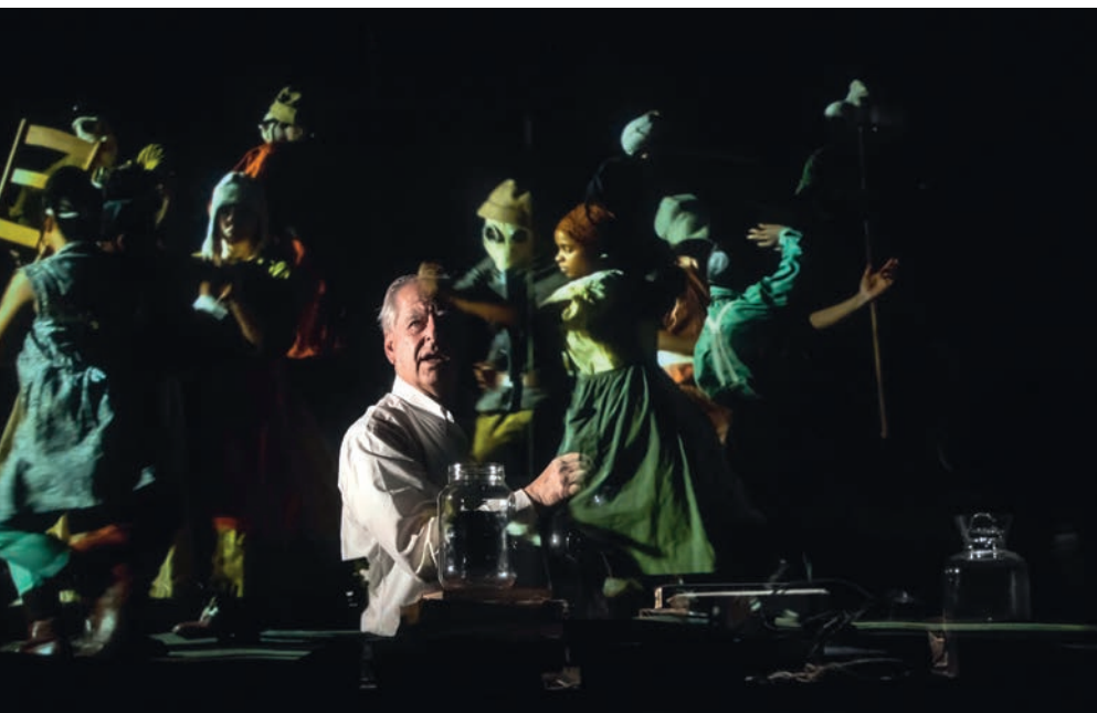
“Centre for the Less Good Idea”, workshop towards season 7, Johannesburg 2020

sentire una relazione personale o che mi fanno vedere un punto d'ingresso drammatico nel mondo, come in “Lulu” di Alban Berg, che divenne un'opera sull'instabilità degli oggetti del desiderio, resa attraverso disegni a inchiostro, stampati e frammentati, per essere usati nella progettazione e nella realizzazione. Quindi, una volta avviato un lavoro, inizia l'esame, la ricerca e la sua valorizzazione. Di solito questo accade con le vere realizzazioni. Perciò, c'è una fase esecutiva piuttosto banale, diciamo “a occhi chiusi”, poi quella di ripensamento per capire cosa può essere significativo, cosa sembra privo di prospettive, cosa è proprio “stupido”, cosa appare tale ma potrebbe avere interesse.