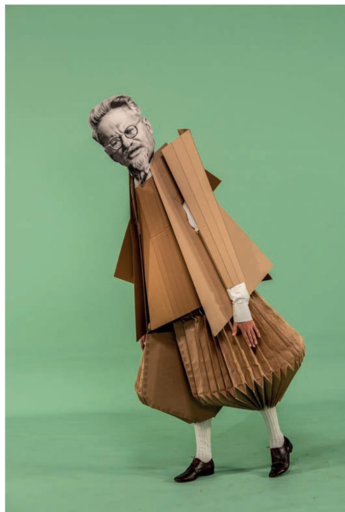
Trotsky per “Oh To Believe in Another World” 2021