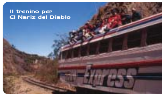
Il trenino per El Nariz del Diablo