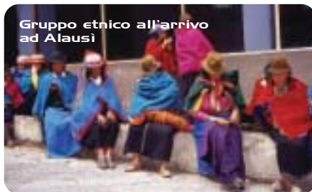
Gruppo etnico all'arrivo ad Alausi

Ci affrettiamo a salire, mentre un addetto offre, per un dollaro, i cuscinetti in affitto a chi va sul tetto. I meno ardentosi si sistemano sulle più comode poltrone all'interno. Dopo aver 'esibito' un prolungato suono da tram d'altri tempi, il conduttore - affiancato da una persona preposta a segnalare (manualmente) situazioni di pericolo - avvia il convoglio che, traballante come un giocattolo, sul binario a scartamento ridotto inizia a farsi strada nell'abitato in mezzo al traffico cittadino. Ad ogni attraversamento stradale o di sentiero, naturalmente tutti senza passaggio a livello o altro accorgimento di sicurezza, suona a più ri-