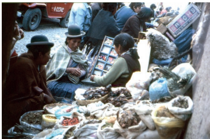
Le "streghe" che vendono amuleti e pozioni magiche