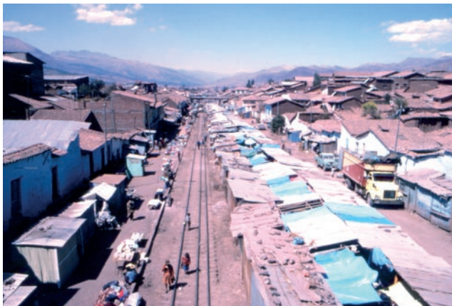
Mercato sulla ferrovia