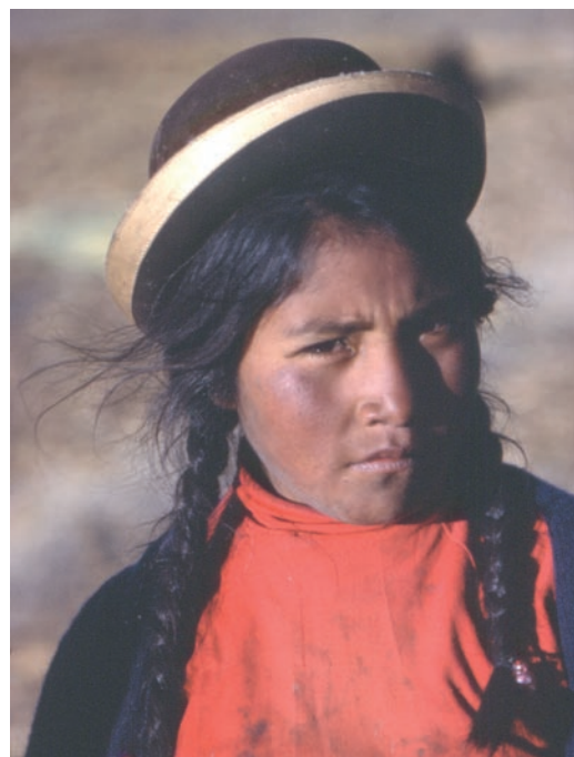
Ai lati: Pastorelle peruviane