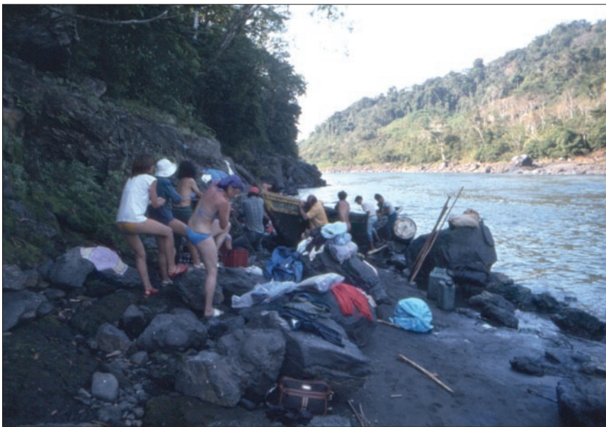
Il recupero dell'imbarcazione