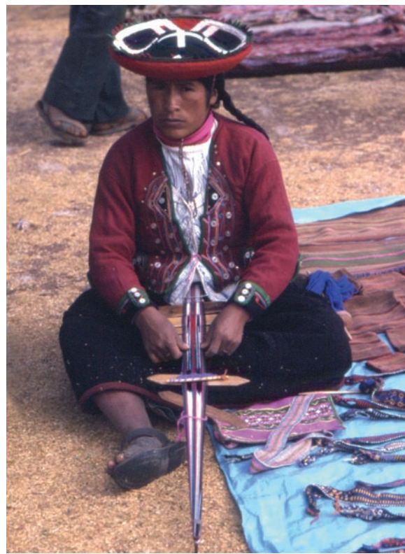
Artigiana che 'tesse' souvenirs