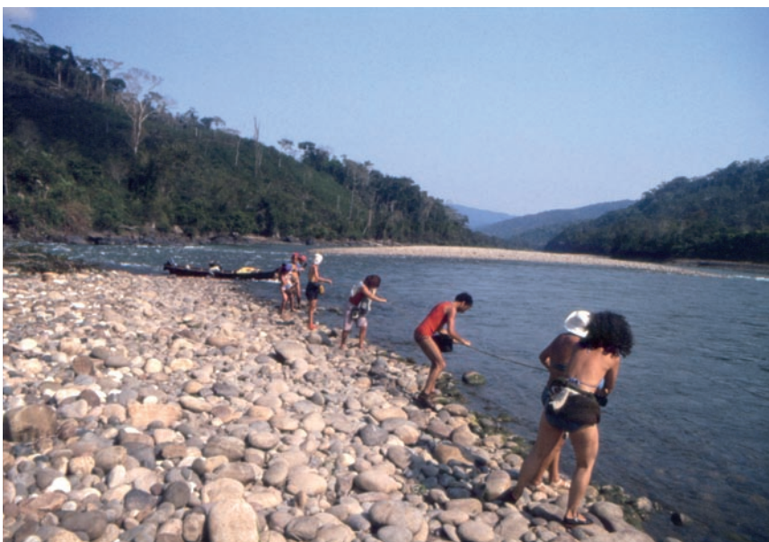
Soccorso alla barca controcorrente

“scuola”. Sul pavimento di canne di bambù circolano grandi scarafaggi rossastri ma, visto che nell’area ci sono anche puma e giaguari e non possediamo alcuna arma per difenderci, non abbiamo scelta. Noi due ci posizioniamo sopra una stretta panca (uno in piano, l’altro di fianco). Per non cadere durante il sonno, ci facciamo legare con due strisce di plastica; in cambio offriamo il DDT in polvere a quelli costretti a stare in compagnia degli indesiderati insetti.