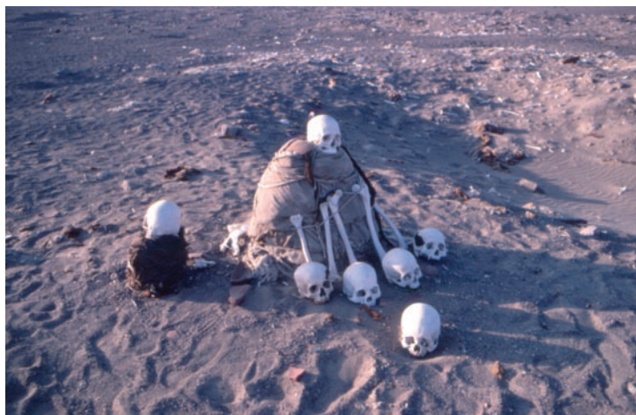
Resti umani nella necropoli di Chauchilla nei pressi di Nazca

Il giorno successivo si va a Nazca , una delle mete più ambite per i chilometrici disegni e le linee tracciate 2500 anni fa dai nativi che forse cercavano un contatto con il cielo. Era il 1927 quando un pilota notò le strane figure che sembravano incise sul suolo, decodificabili solo dall'alto, che a tutt'oggi restano uno dei misteri più suggestivi della Terra. Si dice che potrebbero essere stati fatti a scopo religioso, per essere visti dagli dei celesti. Nel 1949 una illustre archeologa tedesca dell'Università di Amburgo, Maria Reich (scomparsa alcuni anni fa), si mise a studiare quelle antiche testimonianze e fece di esse lo scopo della sua vita, ipotizzando che