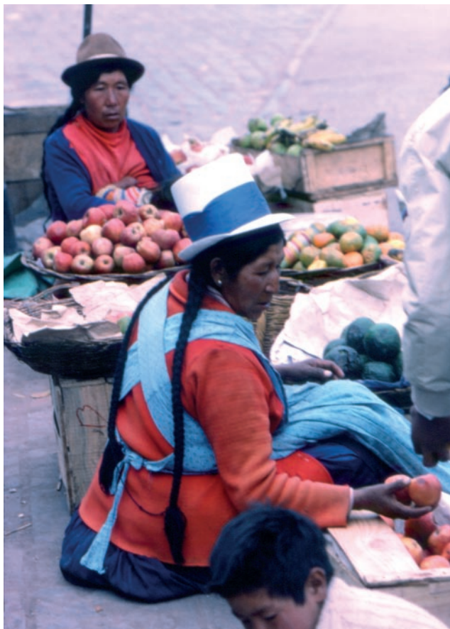
Venditrici di frutta