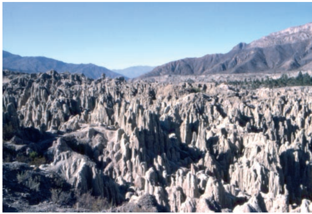
Un scorcio della Valle della Luna nei pressi di La Paz

L'indomani raggiungiamo il monte Chacaltaya (a 30 chilometri), oggi con le piste sciabili più alte del mondo. Con un camion che riesce a superare le difficoltà stradali, saliamo fino alla base. Al rifugio, per 100 lire, ci offrono il solito mate de coca che aiuta a sopportare l'altitudine. Quasi tutti affrontiamo a piccoli passi la dura scalata degli ultimi 200 metri del ghiacciaio (di color azzurro vetriolo) che ci porta a quota 5570, con il piccolo osservatorio da cui si può scorgere anche il Cile. Lassù si respira affannosamente, il cuore batte veloce e si avvertono tutti i disturbi del soroche (mal di montagna). Soddisfatti per aver battuto il record personale della verticalità, ci avviamo verso Cuzco (l'ombelico del mondo): antica capitale dell'Impero Inca con le