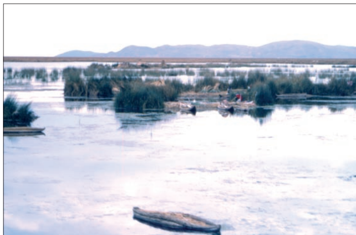
Veduta del Lago Titicaca