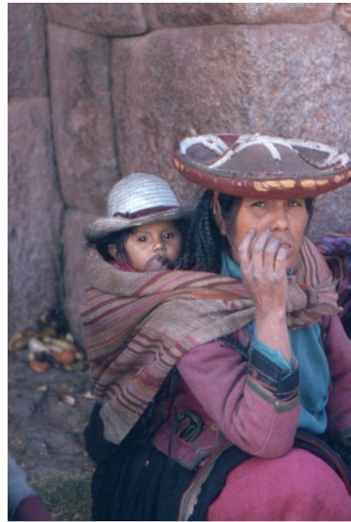
Maternità sulla Cordigliera