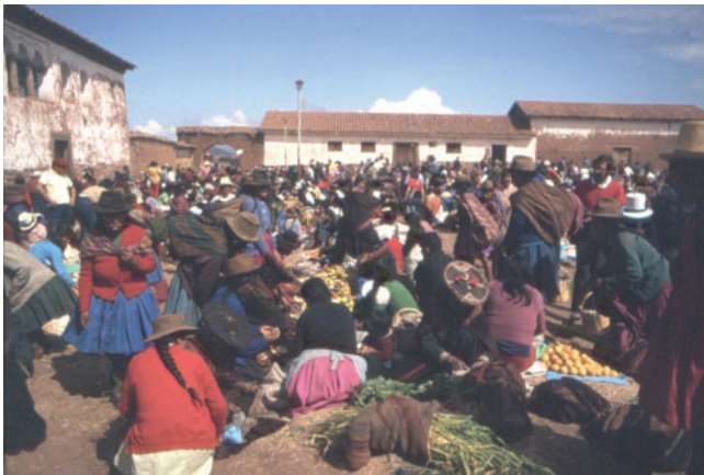
L'affollato mercato di Chincho

Non ha panche per farci sedere e ci affrettiamo a scegliere... uno spazio tra sanguinanti zampe di mucca, ruote di camion, verdure, pesce secco..., che diffondono un mix di odori nauseanti. Anche a causa del polverone, siamo costretti a imbavagliarci con fazzoletti. La strada sterrata, con buche e sassi, non permette rilassamenti, anzi facciamo fatica ad attutire i sobbalzi e a restare sul posto... Come se non bastasse in alcuni tratti veniamo sferzati dai rami degli alberi.