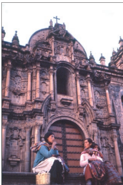
Siesta davanti a una chiesa del centro di La Paz

Superando il dislivello dalla costa all'interno, il trenino procede a zig-zag, avanti e indietro. L'andatura è lenta, ma favorisce l'acclimatamento. I vagoni sono sempre pieni di indigeni, famosi per l'arte... di rubare. Giacché non ci sono posti a sufficienza e si infilano anche sotto i sedili, siamo costretti a legare i bagagli. E ad ogni fermata o