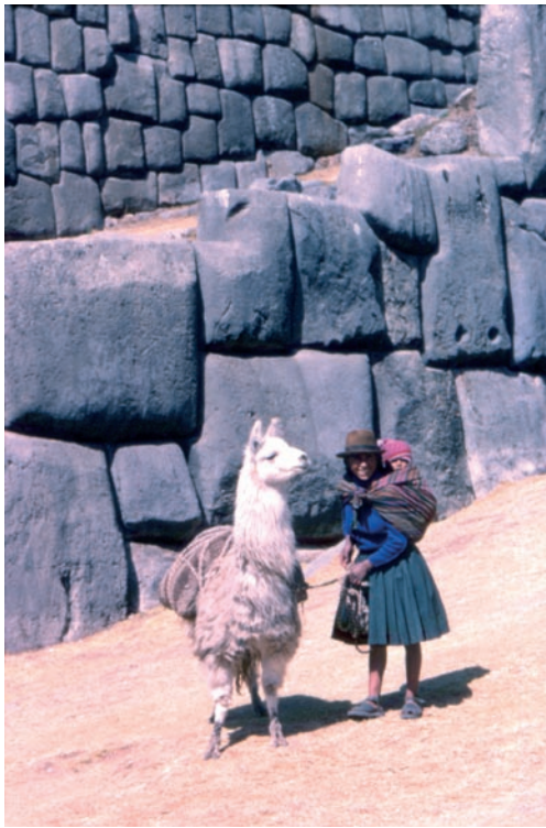
Peruviana con lama nella Valle Sagrada di Cuzco