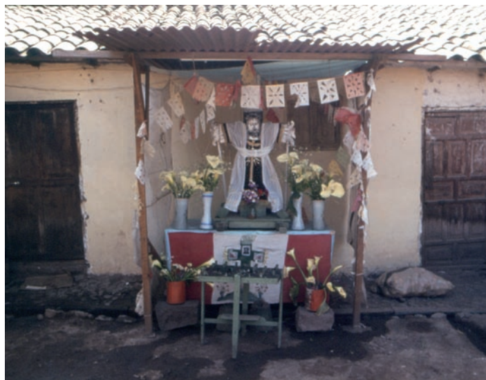
Altarino della devozione popolare nella zona di Cuzco

preoccupati ma contenti di non essere andati in pasto ai voraci pesci piraña che popolano quel fiume. Ci tranquillizziamo e, scherzosamente, scriviamo un messaggio che affidiamo a una bottiglia lanciata in acqua. Gli indios della foresta, accortisi del nostro strano sbarco, vengono a curiosare. Sfregando le pietre, come fossero tornati nella preistoria, accendono un piccolo falò per farci scaldare e ci offrono dei lime (agrumi dal sapore dolciastro). Finalmente, da lontano, vediamo arrivare dei turisti. Gridiamo aiuto. Sono francesi.