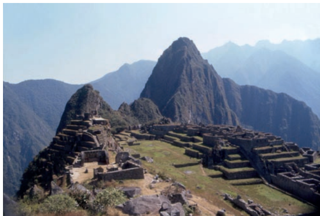
Veduta d'insieme di Macchu Picchu

Lasciato il sito archeologico, torniamo sulla ferrovia per salire sul treno che in tre ore arriva a Quillabamba dove dormiamo. Sveglia all'alba, anche grazie agli insistenti richiami dei galli, e attesa del furgone prenotato per Kiteni , ultimo avamposto prima della foresta amazzonica. Come spesso accade in questi luoghi, il mezzo contrattato non arriva e, in alternativa, dobbiamo chiedere un passaggio all'autista di un camion del posto adibito a trasporto di indios e alle loro mercanzie. Non avendo fatto il pieno, accetta di portarci nel cassone dalle alte sponde e con una pertica centrale per aggrapparsi.