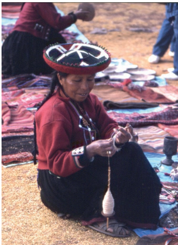
Donna che fila

Dopo otto ore di torture, raggiungiamo la meta e, per non rischiare ritardi, contattiamo subito una 'lancia' per la navigazione di tre giorni sul fiume Urubamba (affluente del Rio delle Amazzoni), noto per le frequenti rapide, divenuto più temibile perché da cinque anni in magra per la scarsità di piogge. Andiamo a occupare due palafitte appartate, gestite da un efficiente occidentale, anche se con un braccio solo (forse un autodeportato... per ignoti motivi), che ci sollecita ad andare al vicino corso d'acqua per lavarci, in quanto "il buio arriva rapidamente"... Obbediamo. Subito dopo, infatti, sopraggiunge la notte. Siamo