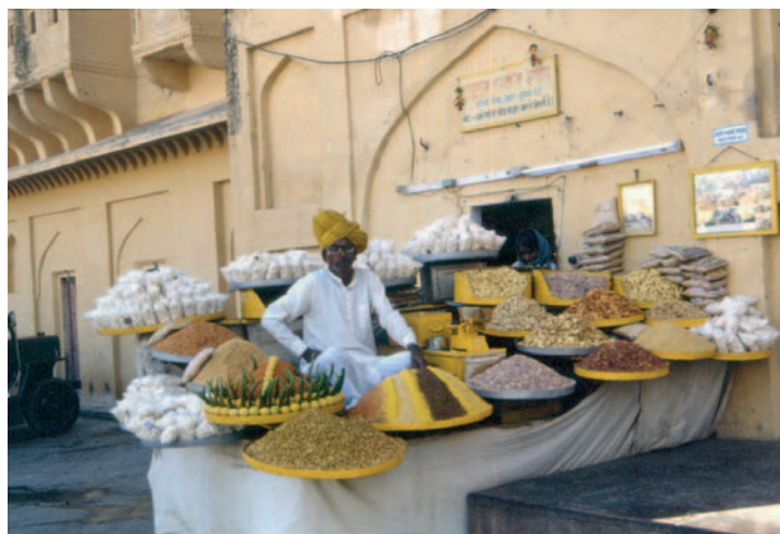
Venditore di spezie