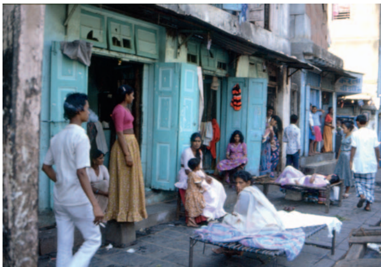
Donne in affitto

Vivere all'aria aperta non è uno svago: i diseredati sono sfortunatamente legati alla natura.