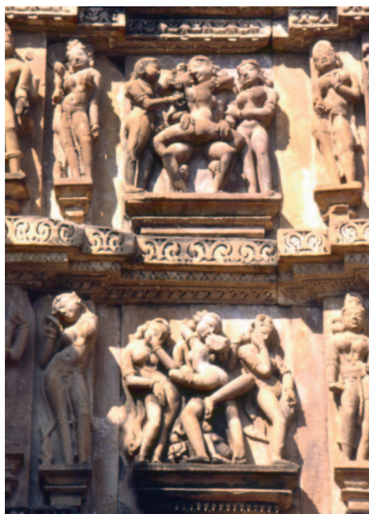
Bassorilievi erotici in un tempio di Khajuraho

Visitiamo la fortezza in arenaria rossa, costruita dagli imperatori Mughal, e il più famoso Taj Mahal, mausoleo del 1600 dichiarato patrimonio dell'umanità dall'UNESCO - come i templi di Khajuraho - e una delle sette meraviglie del mondo moderno: tomba e moschea insieme, fatta edificare da un imperatore in memoria della moglie preferita, deceduta dando alla luce il 14esimo figlio. Per costruirla furono impiegati i più raffinati materiali, tra cui un marmo bianco che cambia colore a seconda dell'incidenza della luce e 28 tipi di pietre preziose (diapro, giada e cristalli, turchesi, lapislazzuli, zaffiri...) incastonate nel marmo, provenienti da vari paesi dell'Oriente. Per accedere al complesso architettonico si percorre un ampio giardino di 300 metri quadrati con aiuole fiorite, canali d'acqua (che riflettono il Taj), viali alberati.