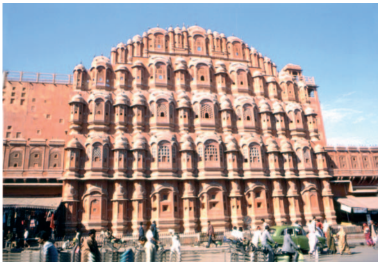
Palazzo dei Venti a Jaipur

Il 4 gennaio si riparte per l'Italia con airbus della Saudia Airways. Alcuni hanno il beneficio della business class usufruendo di gadget , pasti raffinati e altre comodità riservate ai vip. Il volo è full con indiani che vanno in Arabia Saudita e Arabi che tornano in patria. È previsto lo scalo a Dhahran, poi l'imbarco su Alitalia, ma ci accorgiamo che la compagnia italiana ha fatto pasticci e i posti per il gruppo sono stati dirottati... Fuori programma ci assegnano il sontuoso Dhahran Hotel, lo stesso che alcuni anni dopo rivedremo in TV perché quartier generale della stampa internazionale durante la Guerra del Golfo. Non avendo il visto per circolare sul suolo arabo, siamo reclusi in albergo come in una prigione dorata. Vi restiamo tre giorni tra pranzi eccellenti, serviti con scenografie mutevoli, stanze super accessoriate, piscine con acqua calda (ad accesso, in ore stabilite, per soli uomini o donne), boutiques di gioielli, vestiti e oggettistica per nababbi. Alla fine i gestori dell'hotel si commuovono e ci permettono un'ora d'aria...: giro in pulmino con i finestrini protetti da tendine blu da cui sbirciamo il paesaggio, le abitazioni con tanti condizionatori, la moschea e, su una delle colline, la mitragliatrice che difende i pozzi di petrolio. Avendo subito tante ristrettezze nei quindici giorni