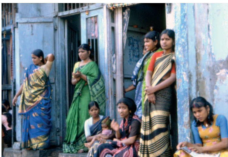
Autoesposizione in attesa dei clienti