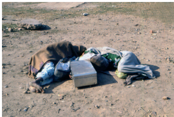
Il riposo di una coppia di girovaghi