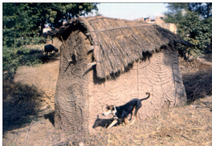
Capanna di fango con segni incisi

A condurci da Jaipur a Mumbai (Bombay) provvede l'aereo. Nel tragitto verso il centro assistiamo a un'impressionante 'sfilata' di poveri che vivono ai lati della strada con le loro poche cose e bivaccano su brandine di fibre intrecciate. Bombay, situata sul Mare Arabico, è una delle più grandi città dell'India con fiorenti commerci marittimi. Ci accoglie l'Hotel Heritage. Tra le tante cose da vedere diamo la precedenza a Pathe Bapurao Marg e a Farkland Road, le vie della prostituzione con edifici fatiscenti in cui si esibisce il più basso degrado morale... Le percorriamo a piedi e ci rendiamo conto di quante minorenni vengono sfruttate, molte provenienti da altri paesi dell'Asia. Anche noi (uomini e donne) veniamo fatti oggetto di ardite avances... Da lì ci spostiamo a Malabar Hill, zona residenziale con eleganti palazzi. La sommità della collina è una giungla, fitta di palme da datteri e alberi di banana, cinta da due pareti concentriche che la proteggono dalle intrusioni della civiltà. Gli abitanti di Bombay le conoscono come dokhmas , le Towers of silence . È in queste strutture