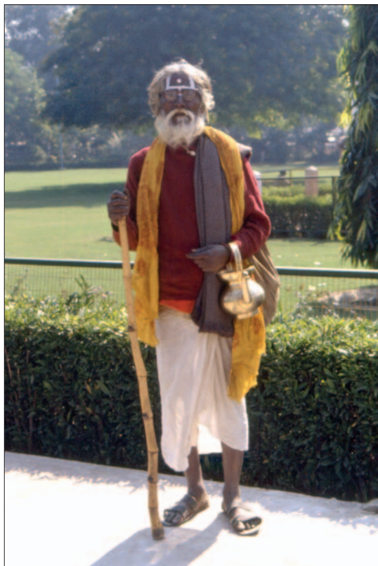
Un santone ad Agra

Meta del giorno successivo l'Amber Fort, costruito nel 1592: in taxi da Jaipur fino all'ingresso della cittadella; da qui alla piazzetta principale sul dorso di elefanti festosamente dipinti. Il palazzo è imponente e fastoso, arroccato su una collina da cui si domina la valle. Alcune stanze sono abbellite con intarsi di specchi. In una, se si accende la candela, gli specchietti simulano un cielo stellato. Abbondano i marmi traforati e le decorazioni. Peccato che gli arredi siano stati trafugati dagli inglesi!