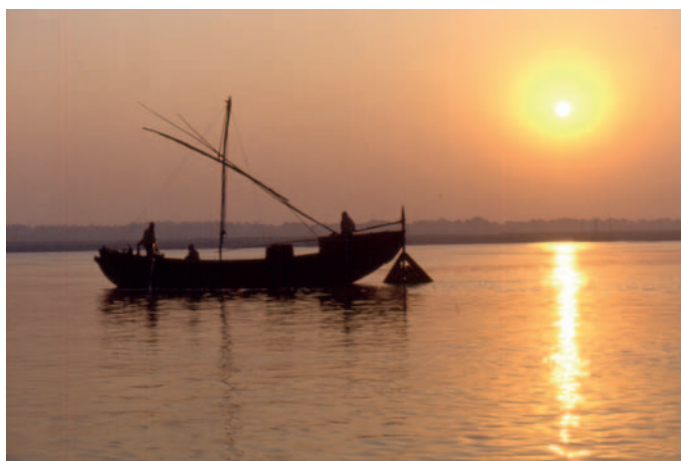
Alba sul fiume sacro

Decidiamo di visitare la città e di andare sulle rive del Gange il mattino dopo, mezz'ora prima dell'alba anche per noleggiare una barca.