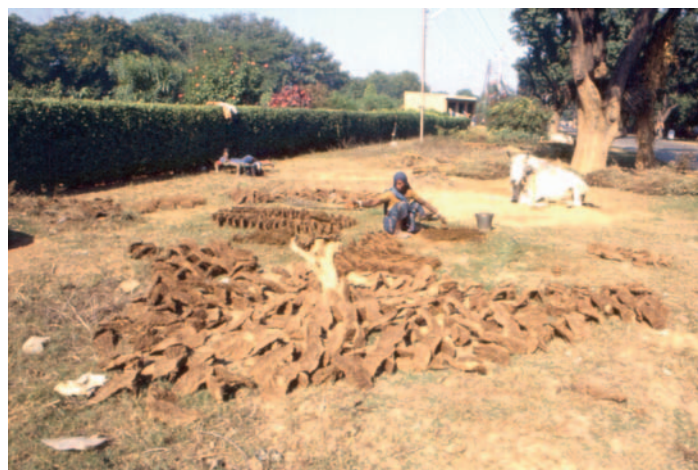
Deposito del combustibile organico