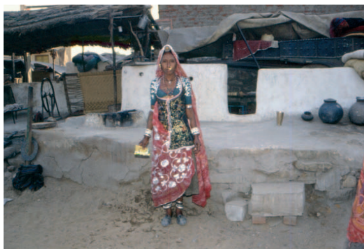
Indiana in veste tribale