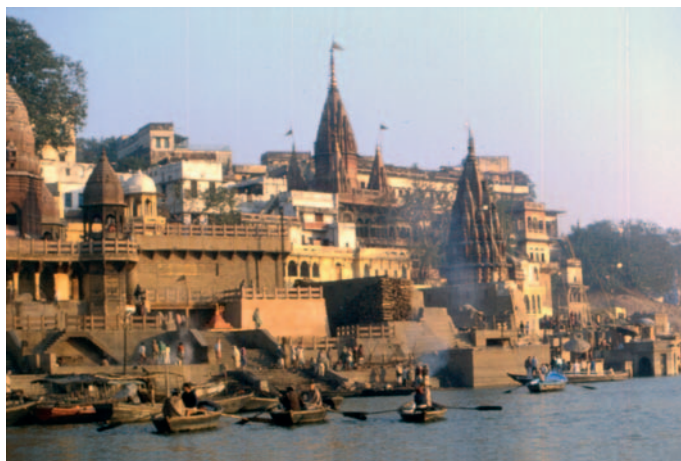
Ghats lungo il Gange a Benares

Con un volo da Kathmandu arriviamo a Varanasi , meglio conosciuta come Benares, una delle sette città sacre, la principale per l'induismo. L'impatto è deludente perché non troviamo l'atmosfera mistica che ci aspettavamo. Vita convulsa, traffico pazzesco che invade la città in ogni strada e vicolo: auto, biciclette, risciò a pedali, apette, camion carichi di mercanzie, autobus con passeggeri appollaiati a grappoli perfino ai finestrini. Come se non bastasse, in mezzo a tutto ciò vagano disinvoltamente scame capre, sonnolente mucche che suonano la campana appesa al collo, cani spesso affetti da rogna... I pedoni indaffarati, come in Nepal, trasportano sulle spalle grandi pesi. Molti masticano e sputano a terra il paan : foglie lucide del piper betel che, unite a noce di areca ( supari ) e a succo di lime, oppure all'estratto di un'acacia, compongono un bolo rosso dall'effetto narcotizzante che tinge la bocca e consuma i denti. Alloggiamo all'Hotel De Paris, antica residenza inglese con ampio parco; facciata da mille e una notte; interno un po' meno; camere per 4 dove dormiamo in coppia.