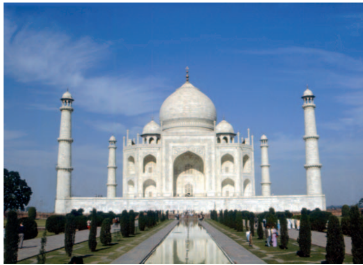
Il magico Taj Mahal

Ad Agra pernottiamo in una casa privata con stanzette che si aprono su un cortile (tre in ogni letto). Per fortuna la notte successiva possiamo beneficiare dei bungalow di un albergo più decente.