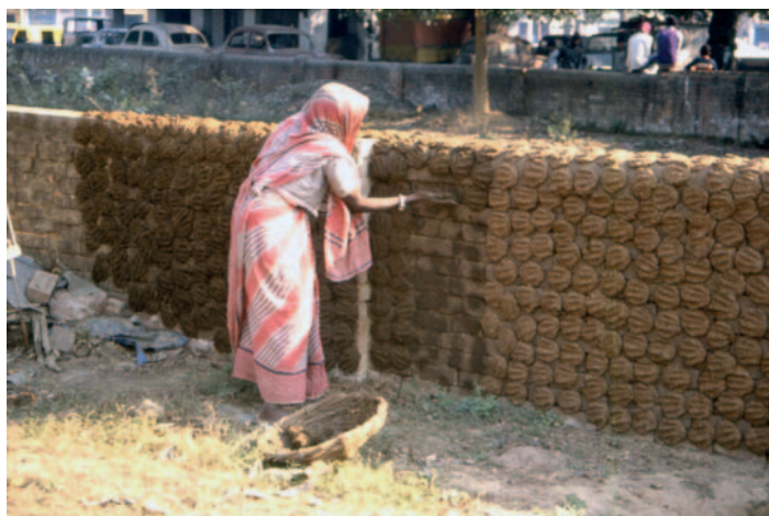
Essiccazione delle 'pizze' da ardere

Da Khajuraho ad Agra utilizziamo il pullman di linea e il treno. Qui è d'obbligo una notazione sui mezzi di trasporto. Gli autisti degli autobus corrono come dannati, suonano ripetutamente il clacson e sterzano bruscamente per schivare questo e quello; si fermano ad ogni paesino dove c'è sempre un mercato;