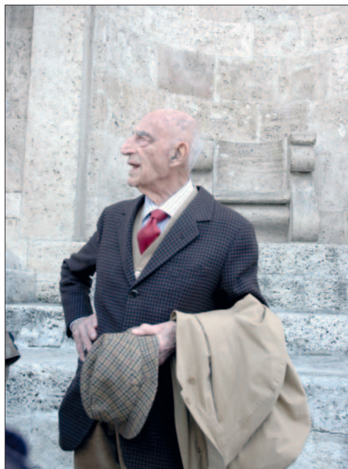
Il critico d'arte davanti al Duomo di Ascoli Piceno nel maggio del 2010

...Soprattutto, direi che ha diffuso un metodo logico e funzionale. Sì, ha applicato un ragionamento matematico, se vogliamo, anche a delle questioni puramente artistiche, però mai dimenticando l'aspetto giocoso dei lavori.