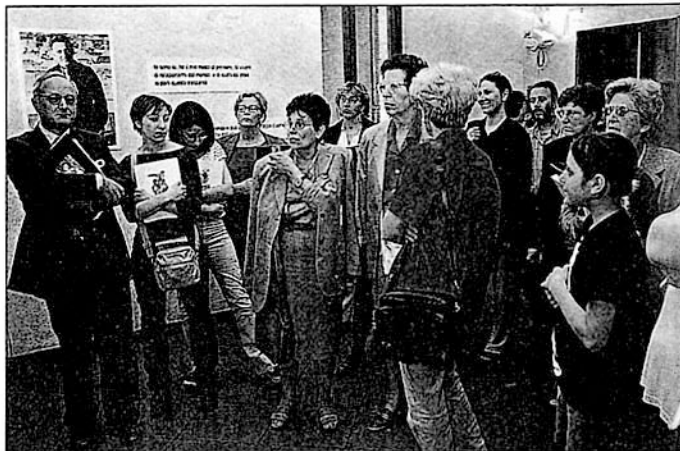
Ascoli Piceno, 2000 - Inaugurazione mostra "Fantaironia".

I ragazzi percepivano subito la forza della sua personalità, lo ascoltavano con trasporto, rispondevano alle sue sollecitazioni con arguzia. I suoi interventi non erano mai scontati: incuriosivano e divertivano. Come ha scritto Marcello Argilli nella prefazione al libro, il Rodari di Ascoli è in stato di grazia, inesauribile, appare come uno straordinario "mercante di sole". "[...] È un uomo che ragiona, scherza, improvvisa con la sa-