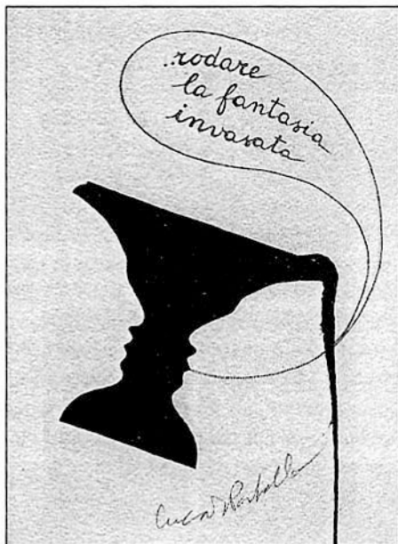
L.M. Patella, Vaso fisiognomico per Rodari, 1999.

Rodari: Solo fino a novantanove anni; dopo scriverò libri per giovanotti e, verso i centoventi anni, solo per signorine bionde. Dopo cinque anni ancora, solo per signorine brune. A centocinquanta anni scriverò per i vecchietti, ma prima per quelli che vanno con un bastone solo, poi per quelli che vanno con due, dopo ancora per i vecchietti che non camminano più. Quando anch'io sarò seduto su una poltrona, scriverò libri per quelli