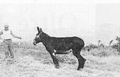
Foto della serie "battitura e spulatura dell'orzo" (1° premio ins. Franco Morganti).

... per la costituzione di un archivio della documentazione visiva sull'ambiente.